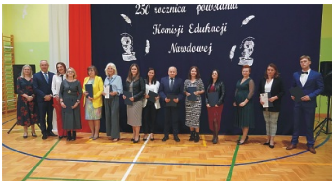
Szkoła Podstawowa im. księdza Antoniego Tyszki w Janowie