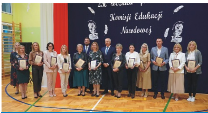
Szkoła Podstawowa im. Kardynała Stefana Wyszyńskiego w Stojątlach