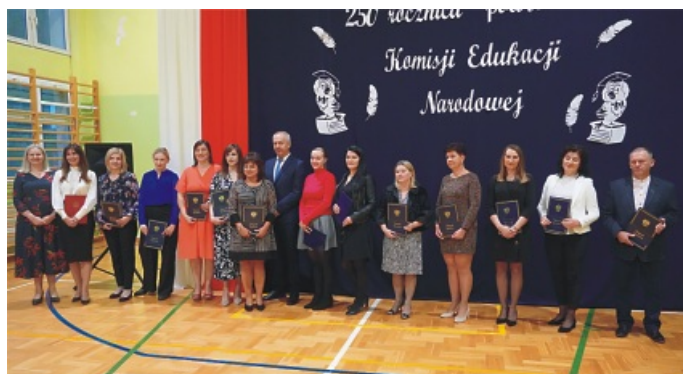
Szkoła Podstawowa im. Rodziny Sażyńskich w Starej Niedziałce