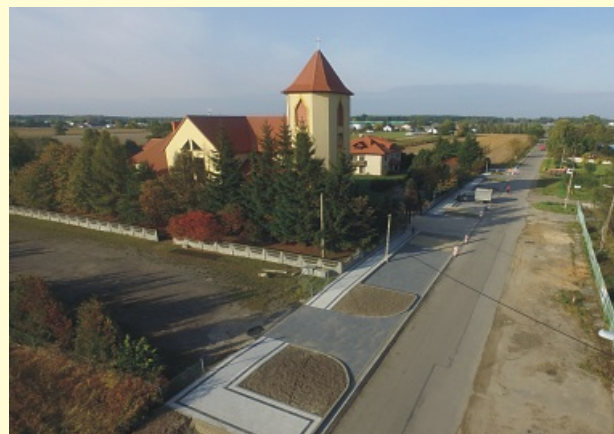
Budy Barcząckie, ul. Długa ▼ Królewiec, ul. Kościelna ▲