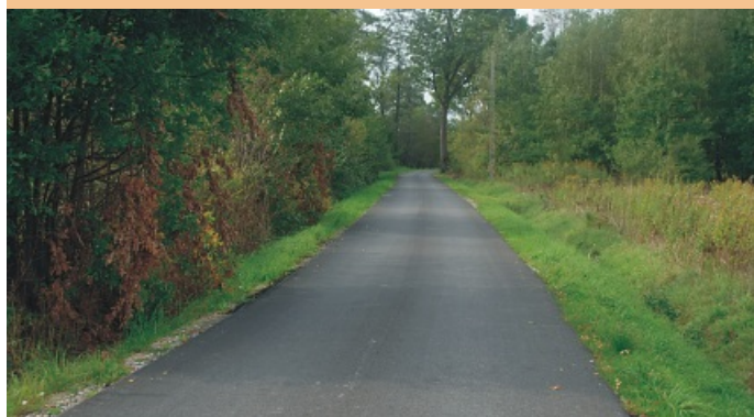
Nowe Osiny, ul. Olszowa