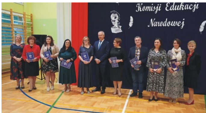
Szkoła Podstawowa im. Marii Konopnickiej w Brzózem