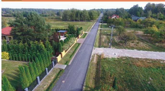
Kolonia Janów, ul. Leśna