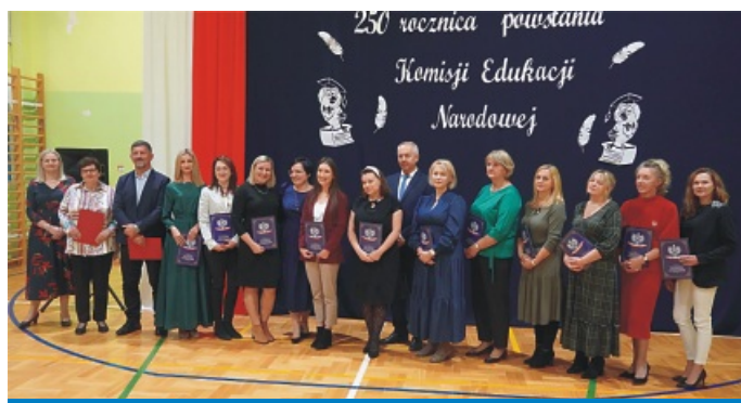
Szkoła Podstawowa im. Marszałka Józefa Piłsudskiego w Zamieniu