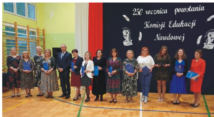
Szkoła Podstawowa im. Karola Wojtyły w Hucie Mińskiej z siedzibą w Cielechówiźnie