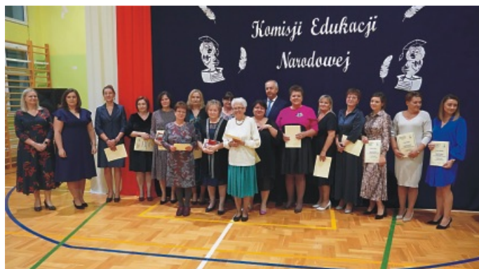
Szkoła Podstawowa im. Generała Józefa Hallera w Mariance