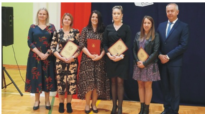
Publiczne Przedszkole „AKWARELKA” w Nowych Osinach