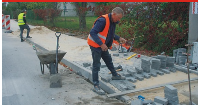
Budowa chodnika w Barczącej, ul. Prosta ▲