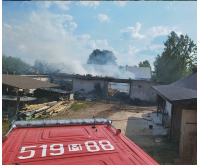
▲ oryginalne zdjęcia z akcji gaśniczej