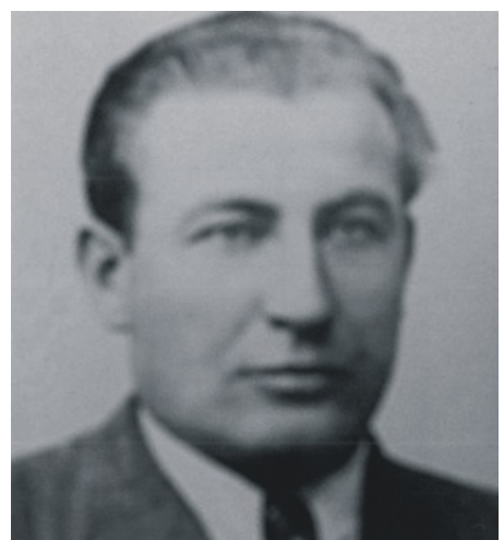
Mjr Ludwik Wolański ps. Lubicz